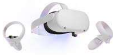
Óculos MetaQuest2

Em breve, traremos mais novidades acerca de nossas instalações e equipamentos.